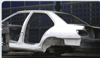
GLASPARELEN / STRALEN